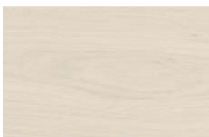
Naturale · Matt